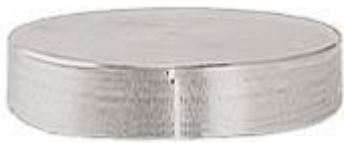
Ø50x10mmh シリンダー SEM サンプルスタブ アルミ製