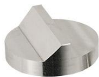
45° / 90° Ø32 x 12 mmh