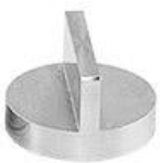
両面 90° Ø25 x 16 mmh