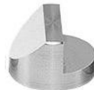
45° / 90° Ø25 x 16 mmh