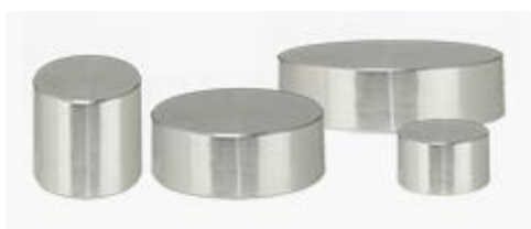
標準シリンダースタブ