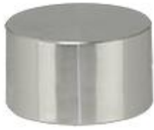
JEOL Ø32x20mmh シリンダー SEM サンプルスタブ アルミ製