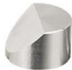
45° Ø25 x 16 mmh